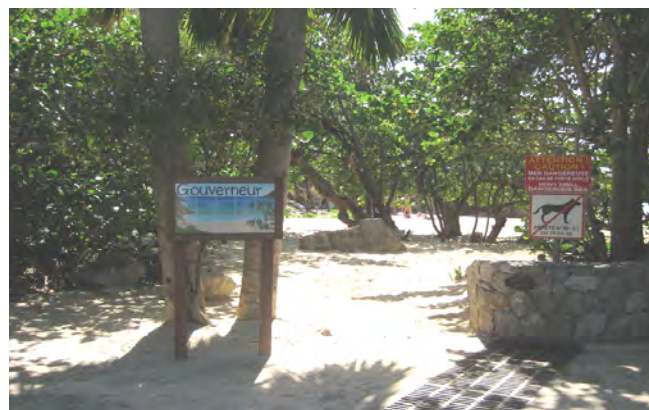
La plage du Gouverneur à St Barths. Pierre's favorite