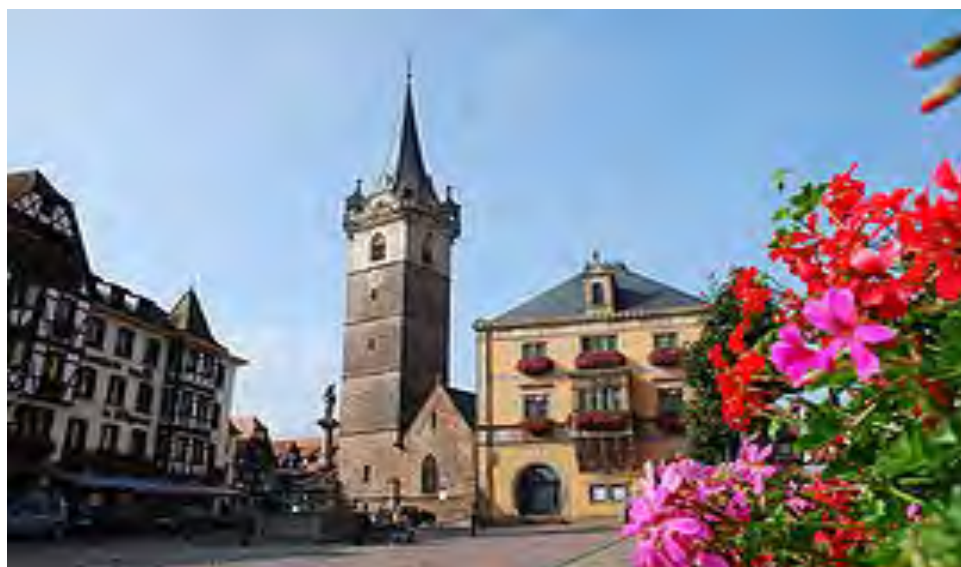
Village of Obernai in Alsace, Pierre's home town